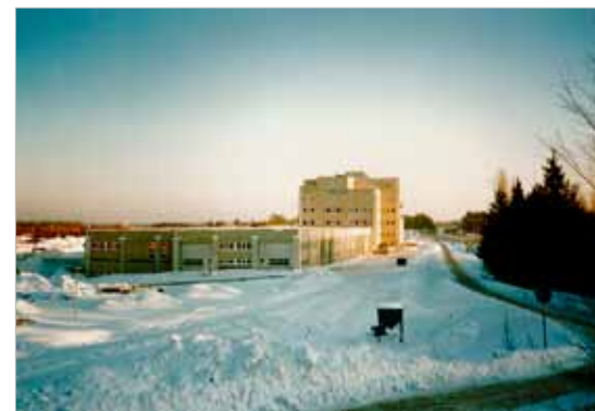
Yllä: Historiansa aikana Seepsula on toiminut myös rakennuttajana. Asunto Oy Tuusulan Palomäki valmistui vuonna 1996.