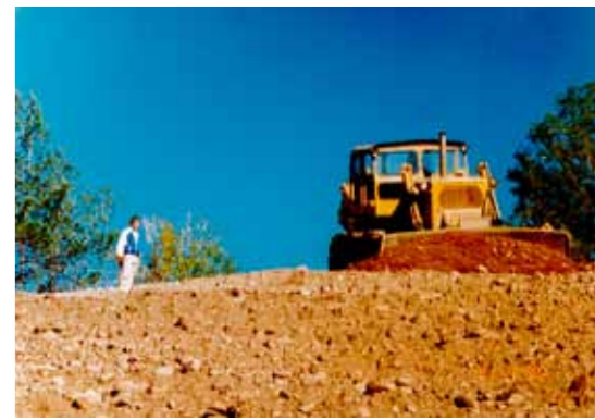
Iso kuva: Seepsula toteutti yhteistyössä Tuusulan Seudun vesilaitoksen kanssa Jäniksenlinnan sora-aseman maisemoinnin 1995. Tuolloin istutetut männyntaimet ovat kasvaneet puun mittoihin ja entinen soraomonttu on nyt vihreä keidas.

Ja pidetään myös tulevaisuudessa. Materiaalina kivi kun on juuri niin vahvaa kuin voi olettaakin. Ikuista.