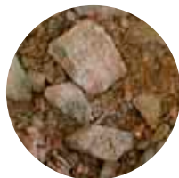
KaM 0–56 mm Jakava/ kantavakerrosmurske