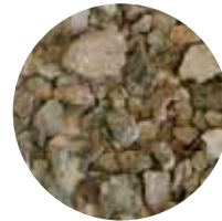
KaS 5–31 mm Salaojasepele