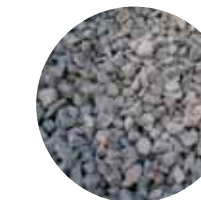
KaS 31–90 mm Maisemakivi