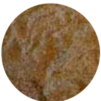
LsR MS 02–2 mm Täytehiekkä