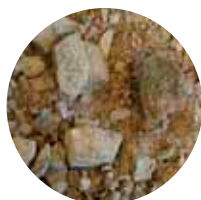
KaM 0–31 mm Kantavakerrosmurske