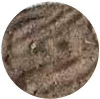
LsR 0–16 mm Suodatinhiekkä