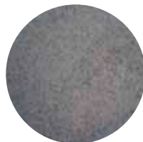
KT 0–3 mm Yleispäällyste