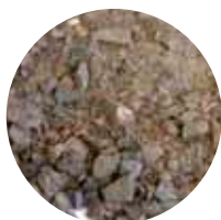
KaM 0–16 mm Kunnossapitomurske