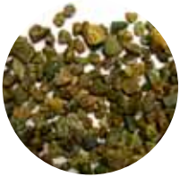
LsR MS 8–16 mm Kattokivi / Kapilaarikatko