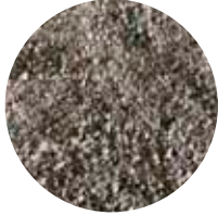
LsR MS 1–5 mm Turvahiekkä