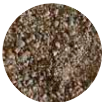
LsR MS 1–8 mm Turvahiekkä