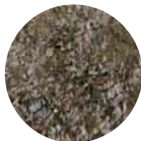
KT 0–5 mm Yleispäällyste