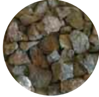
KaS 16–31 mm Salaojasepele