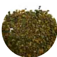
KaS MS 3–5,6 mm Märkäseulottu hiekoitussepele