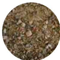
KaM 0–11 mm Kunnossapitomurske