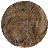
LsR 0–4 mm Muuraushiekkä