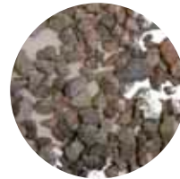
KaS 5–16 mm Salaoja/ Päällystesepele