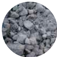
KaM 0–150 mm Jakavakerrosmurske