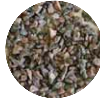
KaS 3–6 mm Hiekoitussepele