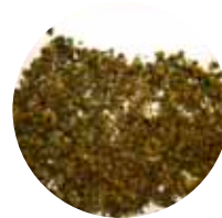
KaS MS 1–5 mm Märkäseulottu hiekoitussepele